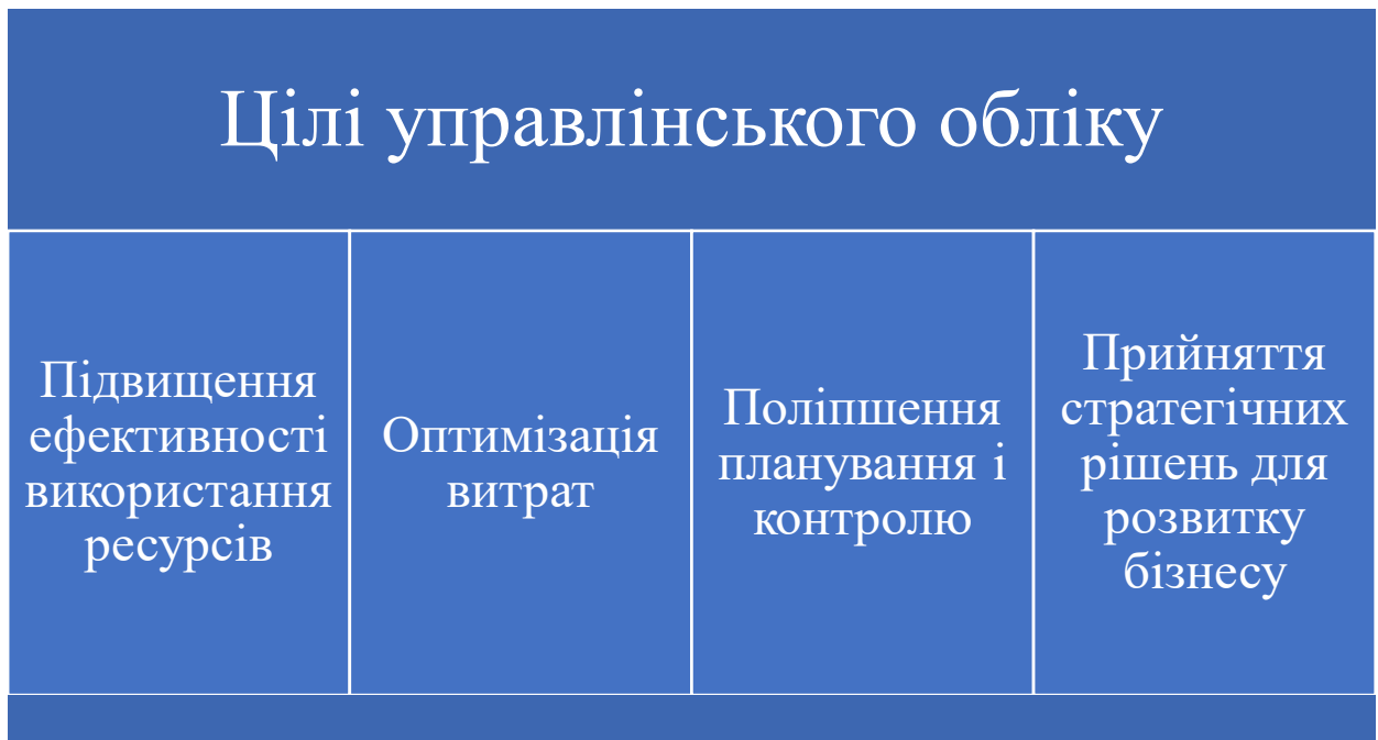
Рис. 3.2. Цілі управлінського обліку

Управлінський облік — це комплексний підхід до збору, обробки та аналізу інформації, що використовується для прийняття стратегічних і тактичних рішень всередині підприємства. Він відрізняється від фінансового обліку тим, що орієнтований на внутрішні потреби компанії, а не на зовнішніх користувачів, таких як інвестори або кредитори [57].