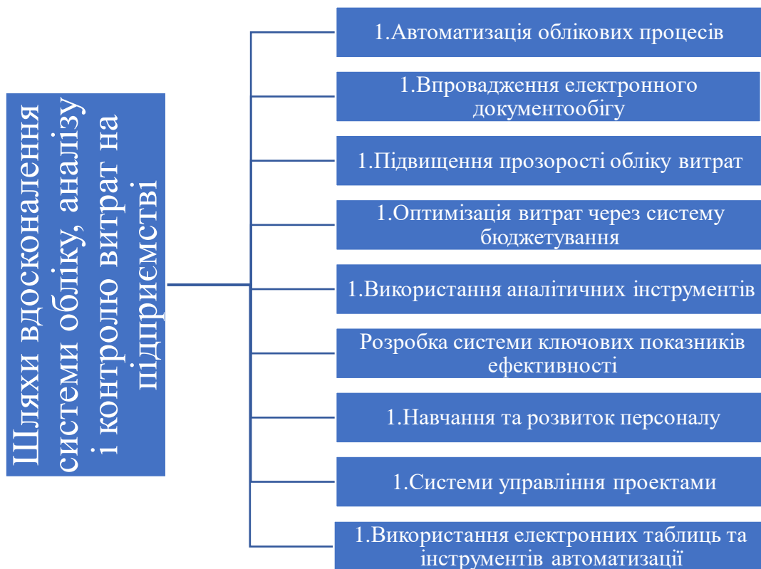
Рис. 3.1. Шляхи вдосконалення системи обліку, аналізу і контролю витрат на підприємстві

такими як управління запасами, бухгалтерський облік, управління персоналом і навіть управління проектами. Це дозволяє створити єдину інформаційну базу, що об'єднує всі аспекти діяльності підприємства, що, у свою чергу, спрощує доступ до інформації та покращує міжвідділову взаємодію.