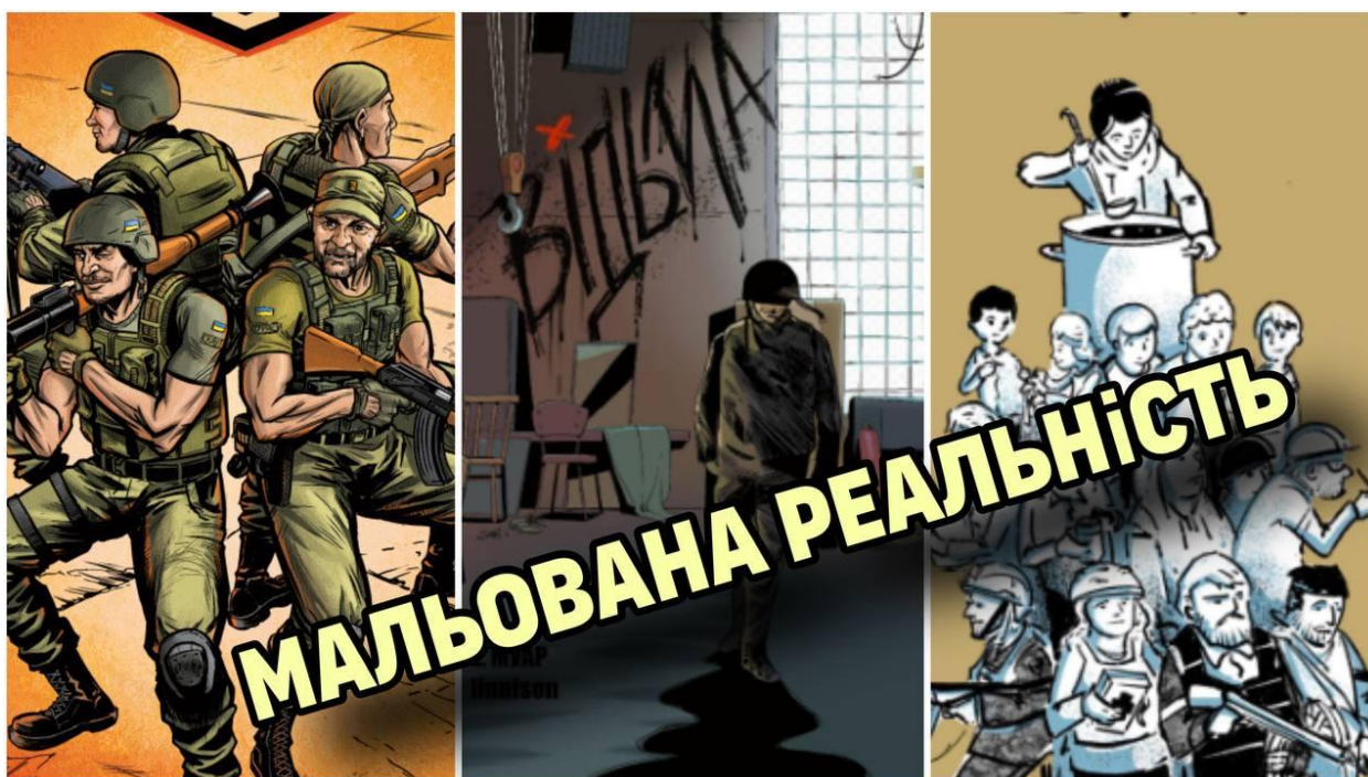
Рис. Д.1. Обкладинка до відеоролику «Мальована реальність: дослідження мальовису як засобу документалістики»