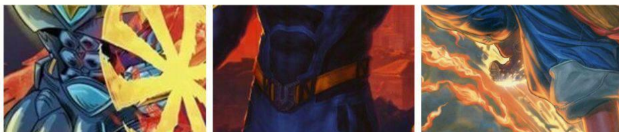
Рис. Д.2. Обкладинка до відеоролику «Супергеройський всесвіт у творах українського мальовису»